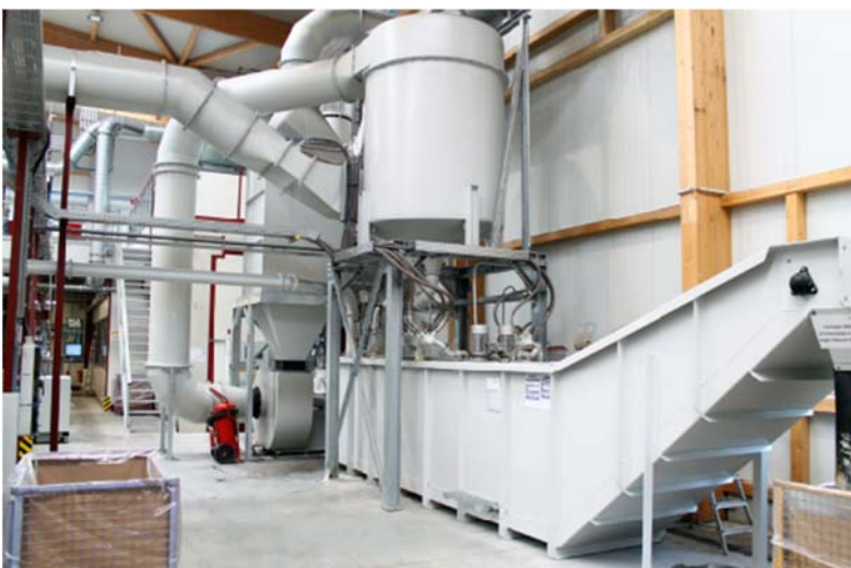
Bild 4: An den Extrudern entweichen neben Stäuben auch klebrige Dämpfe. Diese knifflige Luftreinigungsaufgabe löst der Nassabscheider VDN-TA, der für gute Luft an den Extrudern und in der Halle sorgt. Reinigungsarbeiten spielen daher eine untergeordnete Rolle und die Aurora-Mitarbeiter haben mehr Zeit, sich ihrem Kerngeschäft und der Qualitätskontrolle zu widmen.