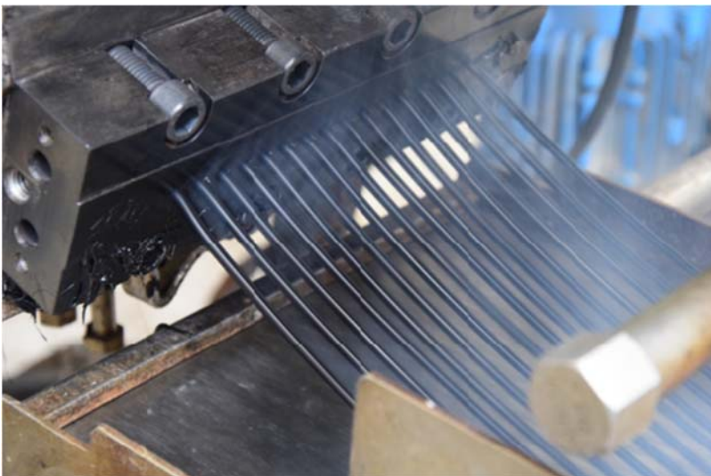
Bild 2: Das zermahlene Ausgangsmaterial wird durch Zugabe von Additiven in einem erneuten Extrusionsprozess zu erstklassigem Recompound verarbeitet, aus dem sich neue Produkte herstellen lassen.

Bild 1: Aurora Kunststoffe produziert aktuell mit fünf Extrudern über 50 Tonnen Recompounds pro Tag. Für die Zukunft rechnet Aurora mit steigender Nachfrage, vor allem wenn es eine gesetzlich vorgeschriebene Recycling-Quote geben wird.