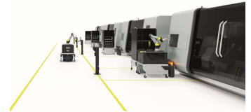
Bild 6: ZOLLER Automation Solutions übergeben Werkzeuge vollautomatisch an die CNC-Maschine – für mehr Produktivität in der Fertigung.

Besuchen Sie ZOLLER auf der Messe EMO in Hannover: Halle 4, Stand E70