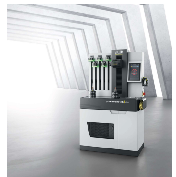
Bild 4: Die neuentwickelte Schrumpfgeräteserie »powerShrink 400/600« für das Schrumpfen von Werkzeugen mit optimaler Energieeffizienz und maximaler Sicherheit.