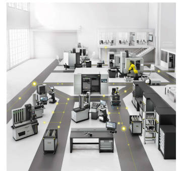
Bild 1: ZOLLER zeigt sein umfassendes Produkt-Portfolio vom wirtschaftlichen Einstell- und Messgerät als Basisausstattung bis zur digitalisierten und automatisierten Werkzeugorganisation in einer Smart Factory.

In der Arbeitsvorbereitung werden die Werkzeugdaten mit der Software TMS Tool Management Solutions erfasst. Übersichtlich und strukturiert werden Werkzeuge im Lagersystem Smart Cabinets gelagert und verwaltet. Die Werkzeugschränke »toolOrganizer« sind für Schneidwerkzeuge und Kleinteile aller Art ausgelegt. Die stabilen Lagerschränke »keeper« nehmen Komplettwerkzeuge und Werkzeughalter auf. Die Werkbank »toolStation« stellt für das Fachpersonal einen optimalen Arbeitsplatz zur komfortablen Werkzeugmontage und -demonstration bereit. Zum Schrumpfen der Werkzeuge eignen sich vorteilhaft die energieeffizienten, ergonomischen Schrumpfgeräte der Serie »powerShrink 400/600«. Um Werkzeuge zu wuchten, nutzen die Fachkräfte die hochpräzise und sichere Wuchttechnologie »toolBalancer«. Eingestellt und gemessen werden die vorbereiteten Werkzeuge auf den Einstellgeräten »smile« oder »venturion«, in die Magazine der CNC-Maschinen gelangen sie automatisiert mit Hilfe der Automationssysteme »coraLogistic«, »loadBox« oder »roboBox«.