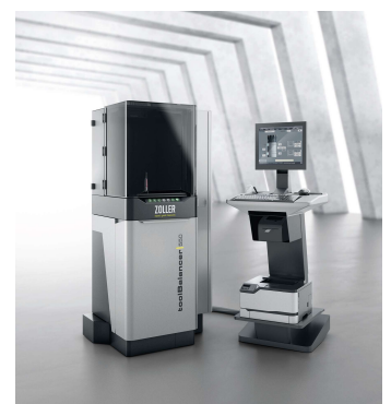
Bild 5: Mit dem von ZOLLER neuentwickelten Auswuchtsystem »toolBalancer 550/750« wuchten Sie Ihre Werkzeuge mit modernster Technologie und ergonomischem Design.