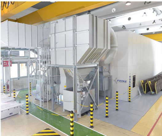
Bild 1: Das Gesamtpaket, bestehend aus Fooke-Fräsmaschine mit Volleinhausung (im Hintergrund) und der Entstaubungsanlage von Keller Lufttechnik (im Vordergrund), entsprach genau den Vorstellungen des Betreibers und berücksichtigte alle Vorgaben.

Zu dieser Presse-Information ist folgendes Bildmaterial im „Infocenter“ unter www.keller-lufttechnik.de/ zum Download erhältlich: