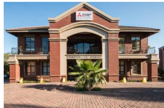
Der South Africa FA Center Satellite wird in Zusammenarbeit mit Adroit Technologies gegründet.

Die Produktion elektrischer Maschinen floriert in Italien, und Mitsubishi Electric rechnet mit einer wachsenden Nachfrage in Hinblick auf Produktsupportdienste im Automationssystemsektor. Gleichzeitig sind in Südafrika zunehmende Investitionen in soziale Infrastrukturprojekte zu verzeichnen. Es wird damit gerechnet, dass japanische Hersteller in größerer Zahl angezogen werden und das Wachstum der lokalen Industrie, zum Beispiel im Bergbau, weiter fördern werden.